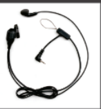
Auricular con PTT & VOX ESS09