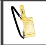
Estuche a prueba de agua amarillo de PVC LCY02