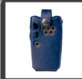
Estuche no giratorio azul PCN002