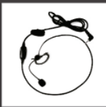
Auricular con micrófono, PTT & VOX EHS09