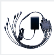
Conmutador de alimentación de 6 unidades (varia en diferentes regiones)