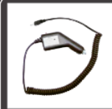
Cargador de Auto PV1001