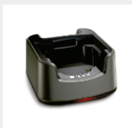
Cargador rápido (para Batería de Li-Ion) CH05L01